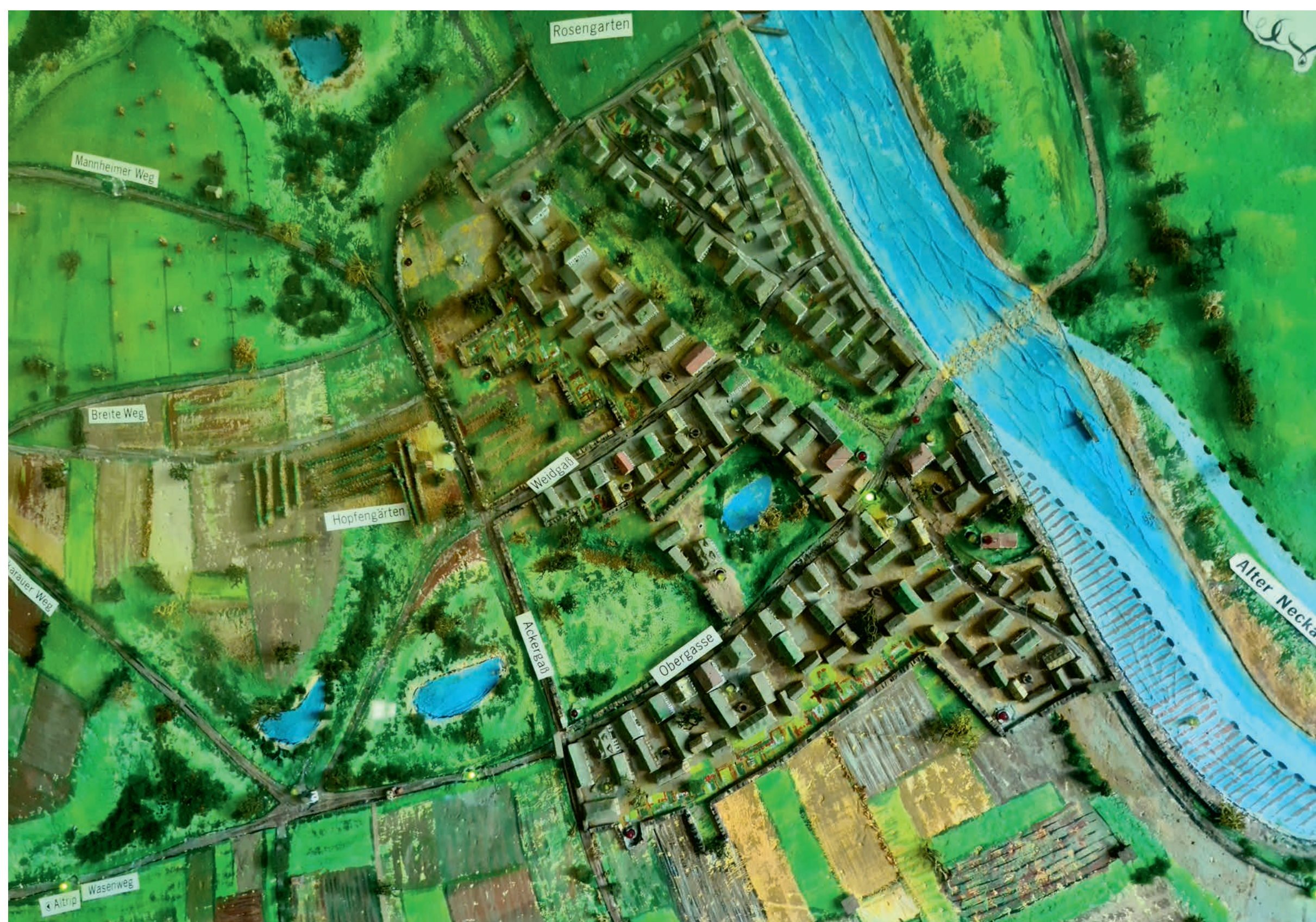
Die Abbildung zeigt den ursprünglichen Seckenheimer Ortsetter mit dem Baubestand um 1750.