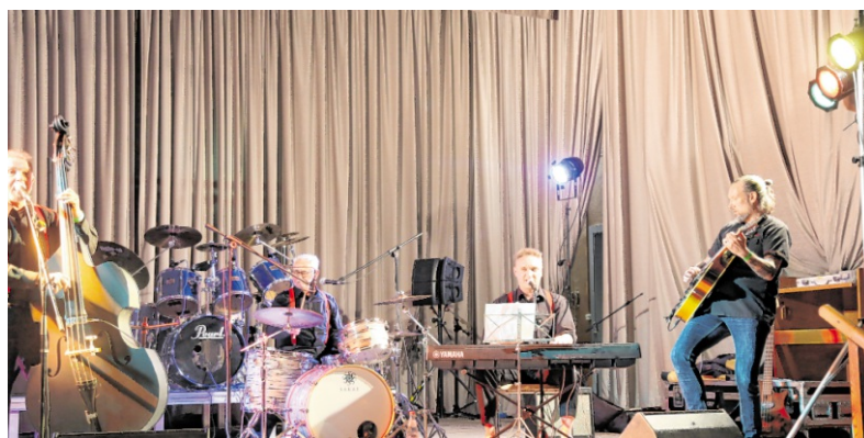
Dr. Weisbrod's Swing Boppers in der Sporthalle.