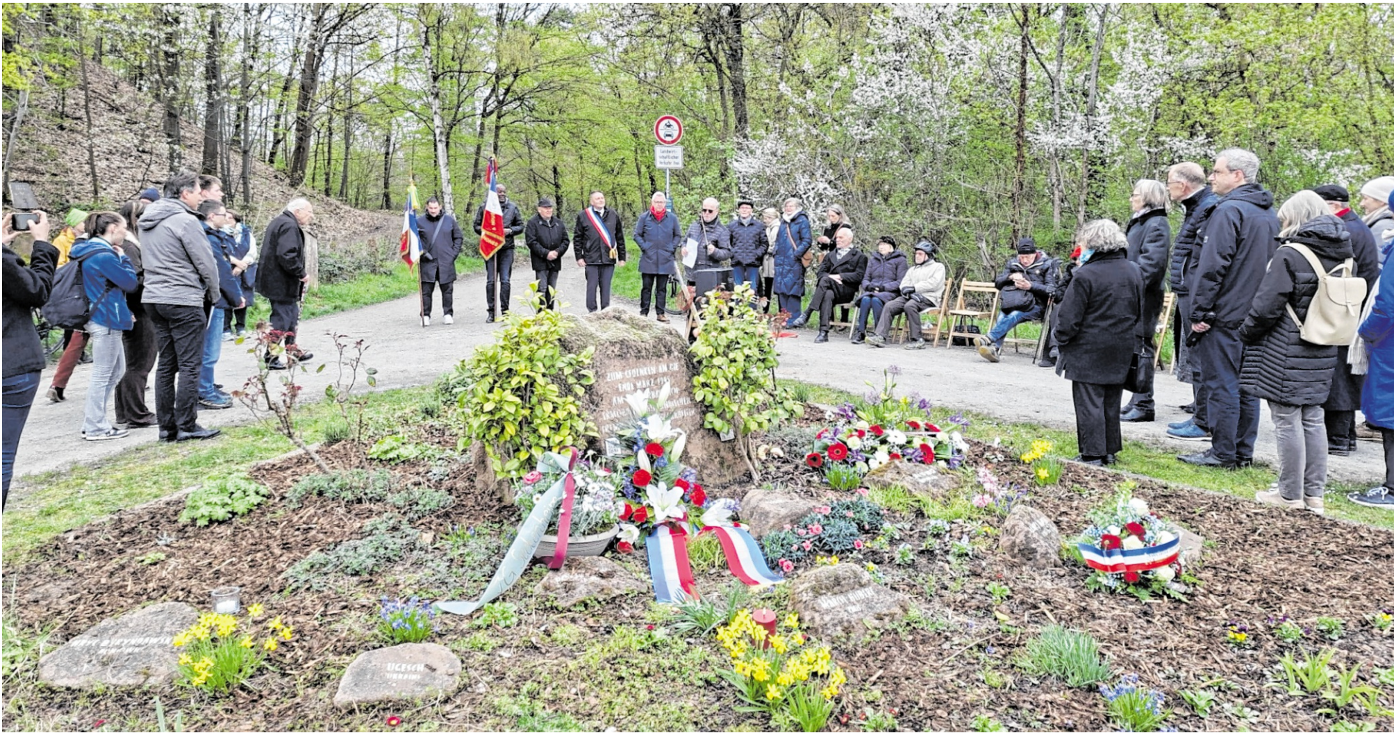
Erinnerung an die ermordeten Zwangsarbeiter am Gedenkhain beim Rangierbahnhof.